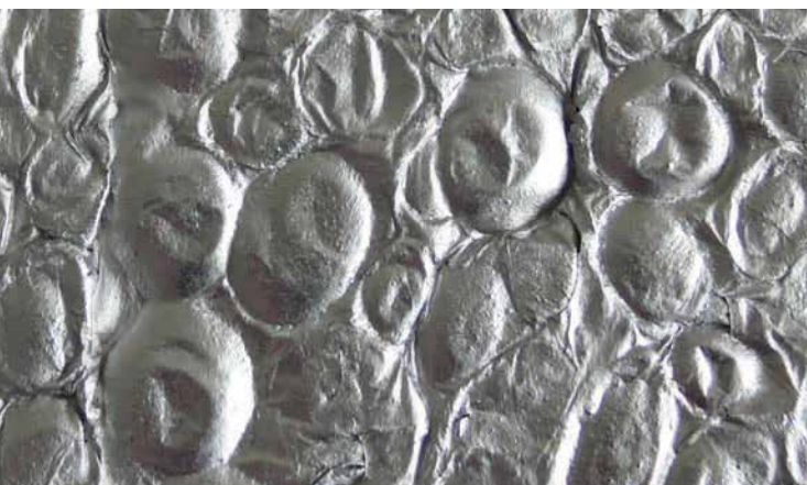
AL-FG-12.7-LG (große Zellen beidseitig geschlossen)