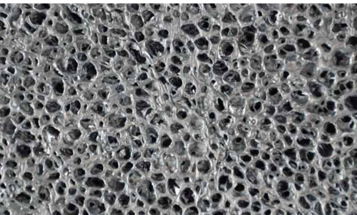
AL-FG-12.7-MD-2S (mittlere Zellen beidseitig geöffnet)